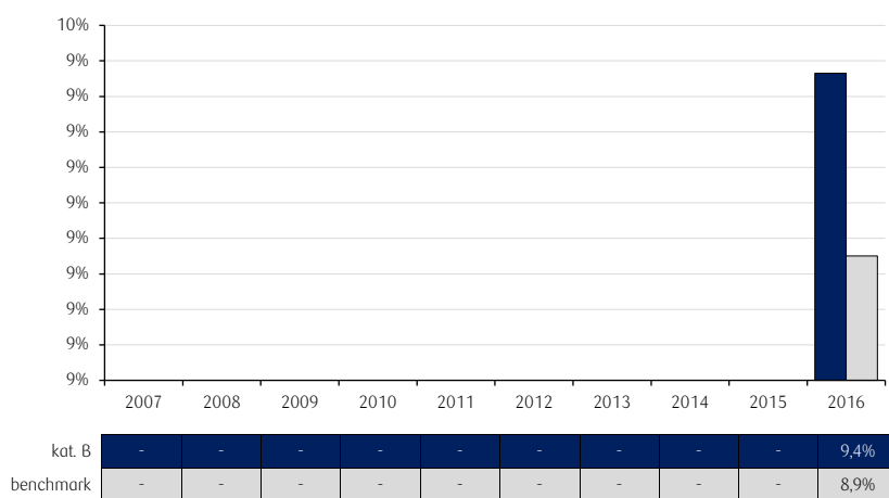
Roczne stopy zwrotu PKO Papierów Dłużnych USD