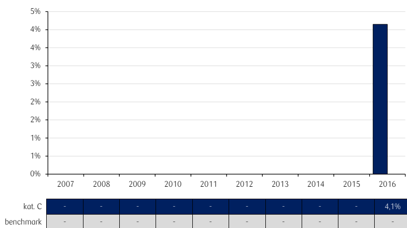
Roczne stopy zwrotu PKO Akcji Dywidendowych Globalny